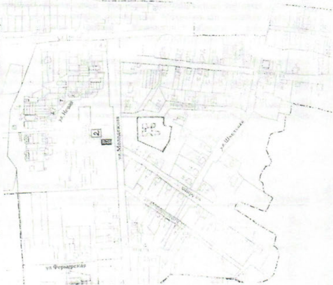
Схема размещения нестационарных торговых объектов Мокрецкого сельского поселения в д. Марковцы